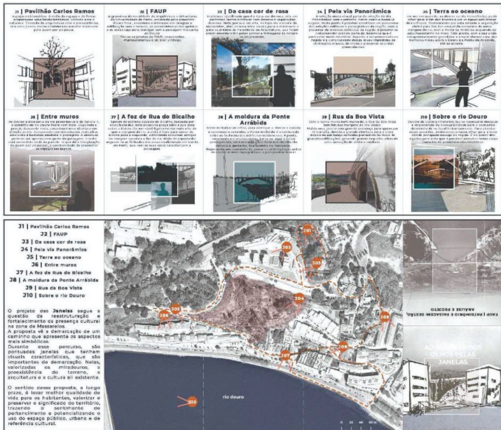
FIGURA 7 • Proposta (flyer destinado à sensibilização, interpretação e conhecimento pela comunidade).