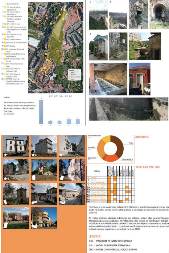
FIGURA 4 • Carta de Significado Cultural (atributo e valores).