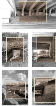
FIGURA 5 • Carta de Vulnerabilidades (riscos e problemas).