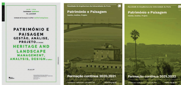
FIGURA 1 • Cartazes de divulgação da Unidade de Formação.