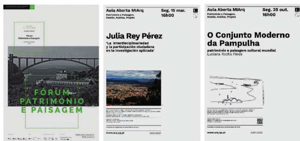
FIGURA 2 • Cartazes de divulgação de Conferência e Aulas Abertas.

Partindo da apresentação de conceitos e correspondente discussão teórica, feita pelos docentes, a partir das respetivas áreas disciplinares, e complementada pelas Aulas Abertas, procura-se proporcionar aos estudantes um laboratório de aprendizagem a partir da exploração de um caso de estudo concreto (no qual o trabalho de campo se assume como uma das componentes chave) e do estabelecimento de um cronograma de trabalho específico. Assim, nas duas primeiras edições o trabalho de campo centrou-se sobre o Vale de Massarelos e nas duas últimas edições, em contexto de pandemia, sobre a área em torno da FAUP, recentemente inscrita na Lista Indicativa de Portugal ao Património Mundial da UNESCO (2017). Apesar dos constrangimentos sociais impostos pela situação sanitária, foi possível mobilizar os estudantes para o trabalho colaborativo à distância, sendo fornecida pelos docentes a informação necessária para o desenvolvimento dos trabalhos.